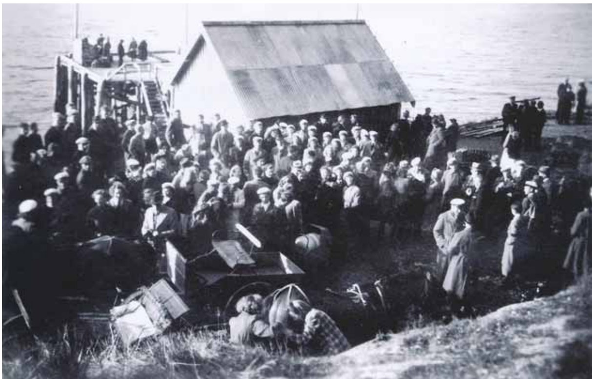
Sangkor ved Jørstadsjøkaia ca. 1938

Allerede sist på 1850 tallet er Jørstad i rutetabellene oppført som anløpssted på nord sida av øya. Det ble da benyttet utroing for å hente og bringe post, varer og reisende. På sør sida av Ytterøy var Hogstad og etter hvert Naust anløpssteder. Trafikken på fjorden var stor og vare- og persontrafikken økte, noe som gjorde at behovet for kai etter hvert ble stort. I 1930 bygde Indherreds Aktie - Dampskibsselskab kaia ved Jørstadsjøen.