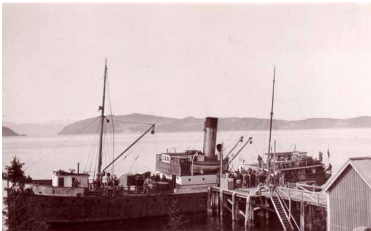
D/S Innherred ved Jørstadsjøkaia omkring 1940-1945

Det vi i dag kjenner som venterommet er ei stue som ble flyttet fra husmannsplassen «Krika» ved Fredheim. Først var venterommet plassert noe ovenfor kaia, men da vegen ble lagt om i 1938 ble venterommet flyttet dit det ligger i dag. Det var i starten utstyrt med en kvarting og en åtting (tønner) til bord og stol. Det store pakkhuset ble bygd i 1942 og brukt til leveranse-lager av landbruksprodukter til den tyske okkupasjonsmakten under krigen.